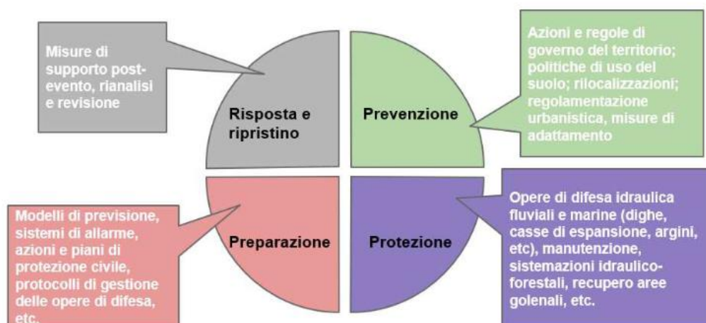
Figura 1 – Tipologie di misure per la gestione del rischio di alluvioni

Il programma delle misure da predisporre per il presente riesame, quindi, deve prevedere una revisione di quello predisposto per il precedente, con particolare riferimento al nuovo quadro della pericolosità e del rischio emerso dalla Valutazione preliminare e dalle nuove Mappe di pericolosità e rischio del dicembre 2015.